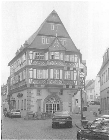
ドイツミルテンベルクのホテル“Riesen” (1158年建立)