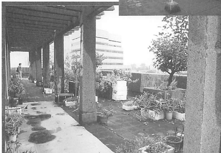
取り壊し直前の旧同潤会大塚女子寮屋上テラス。上は物干し場。