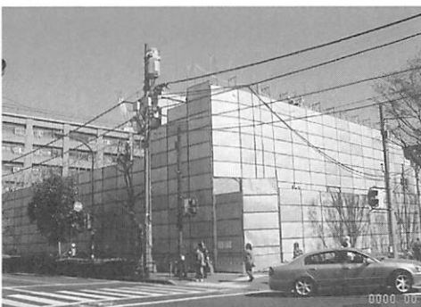
大塚女子寮の取り壊し工事。 平成15年3月～5月に行われた。

取り壊し直前の旧同潤会大塚女子寮の様子、および平成15年3月～5月にかけて行われた同建物の取り壊し工事の様を写真にて示す。