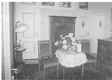
“Riesen”レセプションルーム